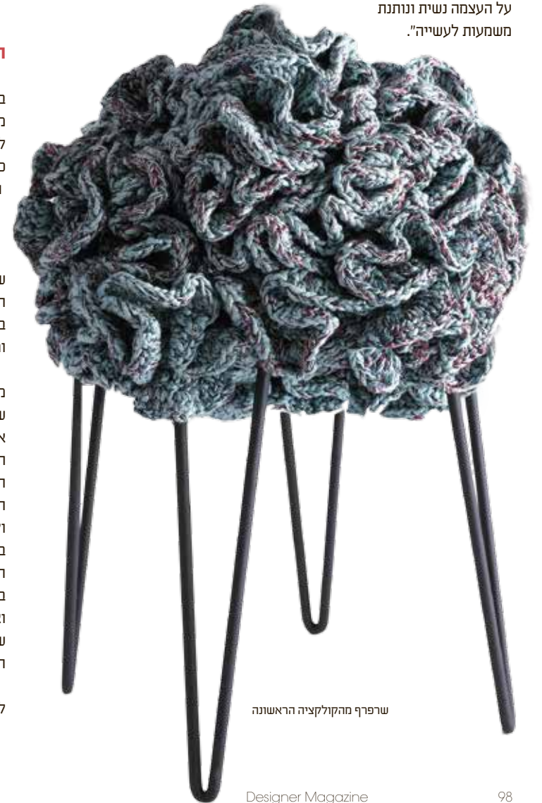
שרפרף מהקולקציה הראשונה

הקולקציה הראשונה שגובשה ב-IOTA כתמהיל שנבע מתחושות בטן, מציגה מנעדים שונים מעולם העיצוב לצד יכולות של מלאכת יד. הקולקציה כוללת שטיחים, פופים, כריות רצפה ושרפרפים בגדלים ובמרקמים שונים, בחלקם בנימורי גדילים. זאת לצד נדנדות אווריריות מעוטרות במבחר אלמנטים סרוגים. כל הפריטים עשויים שילובים של גוונים מעושנים, ובהם חציל, ורוד, בורדו, כחול עמוק, ירוק בקבוק, טורקז, מנטה, זהוב, בז', אפור וגוונים טבעיים למיניהם. הקולקציה הוצגה לראשונה בחודש מאי במסגרת שבוע העיצוב בניו יורק, שם קיבלו המון תגובות חיוביות והבינו את הפוטנציאל האמיתי שבאסופת המוצרים הטקטיליים החוגגים עשייה חברתית, מלאכת יד וצבע, ולא פחות חשוב - המושכים אנשים להתעניין ולגעת. בתערוכת Maison&Objet, בה השתתפו בחודש ספטמבר בפריז, המשיכו לקבל חיוקים חיוביים, מצד בעלי חנויות, קניינים, טרנדולוגים ואמנים, כמו גם אדריכלים ומעצבי פנים, שהביעו עניין הן בפן המסחרי של עיצוב המוצר והן בסיפור החברתי שמאחוריו. "בתערוכה בפריז יכולנו במפורש לראות תפיסה צרכנית מצד קניינים