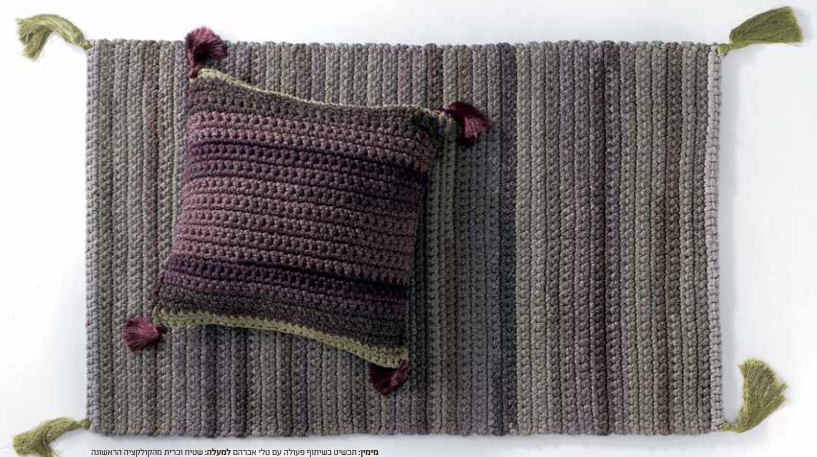
מימין: תכשיט כשיתוף פעולה עם טלי אברהם למעלה: שטיח וכרית מהקולקציה הראשונה

מוטיבציה, אמביציה והרבה אמונה - הן שהניעו את שולה מוזס וטל צור להקים מותג חדש, המבוסס על דיאלוג שווה ערך בין ערכים חברתיים ובשורה עיצובית. בתערוכת Maison&Objet האחרונה בפריז הן כבר זכו להיכלל ברשימת שנים-עשר המותגים המעניינים והמסקרנים. וזוהי רק ההתחלה... / אודית לורן בלקין