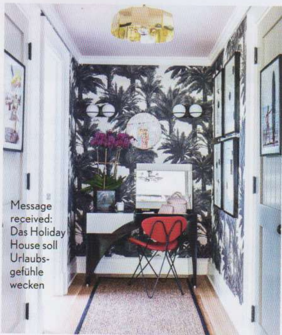
Message received: Das Holiday House soll Urlaubsgefühle wecken