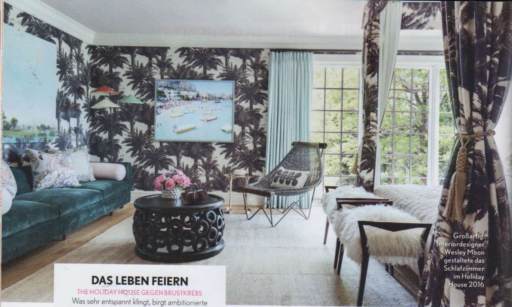
Großartig: Interiordesigner Wesley Moon gestaltete das Schlafzimmer im Holiday House 2016